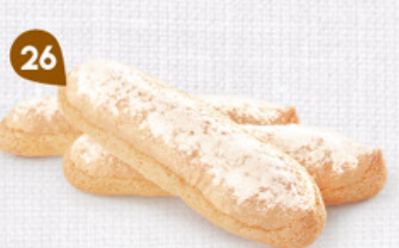
26 BISCUITS CUILLERS 10 étuis de 6 - 400 g DDM* : 5 mois