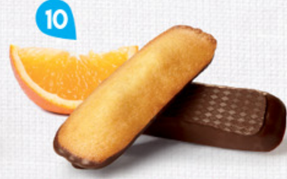
10 LONGUES CHOCHOINOIR ORANGE 20 étuis de 2 - 600 g DDM* : 2 mois