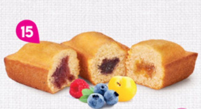
15 PANACH'FRUITS 30 emballages individuels - 990 g DDM* : 2 mois 50% de fruits en plus Mirabelle de Lorraine