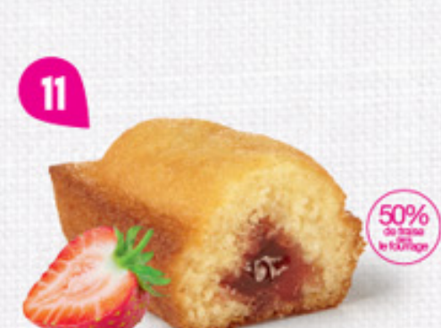
11 BIJOU FRAISE 20 emballages individuels - 660 g DDM* : 2 mois 50% de fruits en plus