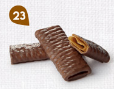
23 MINI CRÊPES CHOCOLAIT 4 barquettes fraîcheur de 18 crêpes 370 g DDM* : 5 mois