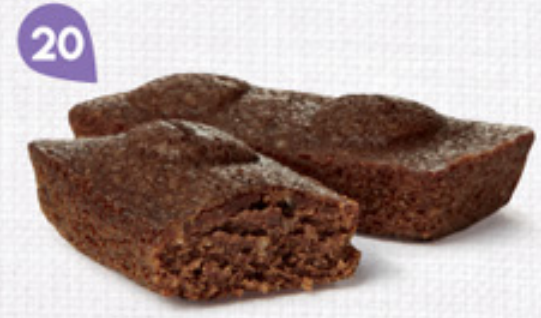
20 MOELLEUX AU CHOCOLAT 30 emballages individuels - 660 g DDM* : 2 mois