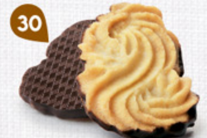
30 SABLÉS VIENNOIS 32 étuis de 2 - 620 g DDM* : 2 mois