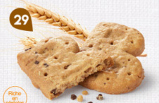
29 P'TIT-DÉJ CHOCOCROUSTILL' 24 étuis de 2 - 670 g DDM* : 5 mois