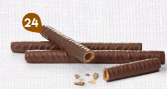
24 BRINS DE CHOCOCARAMEL 4 étuis de 6 - 280 g DDM* : 5 mois