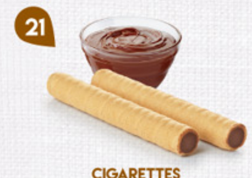
21 CIGARETTES CHOCOLAT NOISETTES 45 étuis de 2 - 575 g DDM* : 5 mois