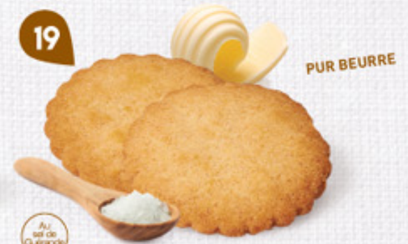
19 GALETTES PUR BEURRE 48 étuis de 2 - 880 g DDM* : 5 mois