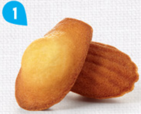
1 MADELEINES NATURE 50 emballages individuels - 880 g DDM* : 2 mois