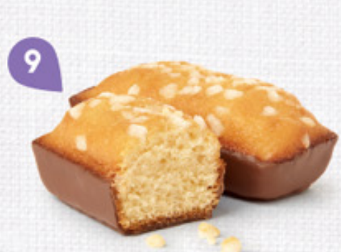
9 GÉNOIS CHOCOLAIT 30 emballages individuels - 920 g DDM* : 2 mois