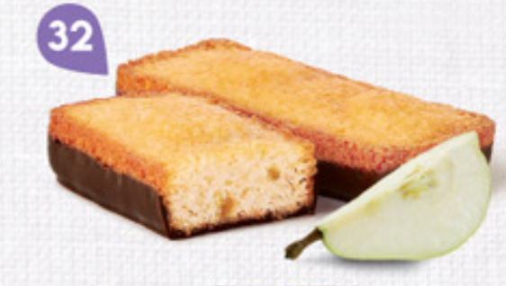
32 FINANCIERS POIRE CHOCHOINOIR 25 emballages individuels - 685 g DDM* : 2 mois