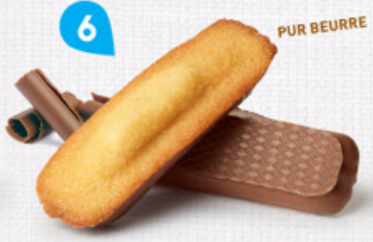
6 LONGUES CHOCOLAT 20 étuis de 2 - 600 g DDM* : 2 mois