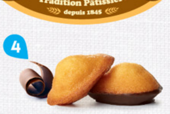
4 MADELEINETTES NATURE ET CHOCHOINOIR 3 sachets de 100g de chaque - 600 g DDM* : 2 mois