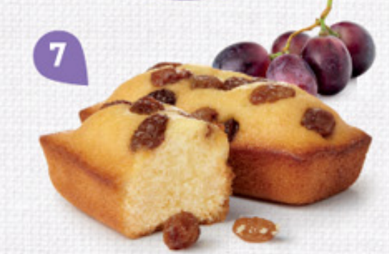
7 CAKES RAISINS 30 emballages individuels - 900 g DDM* : 2 mois