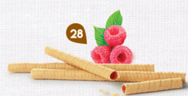
28 BRINS DE FRAMBOISE 7 étuis de 7 - 425 g DDM* : 5 mois Made en France 3% de fruits en plus 50% de fruits en plus