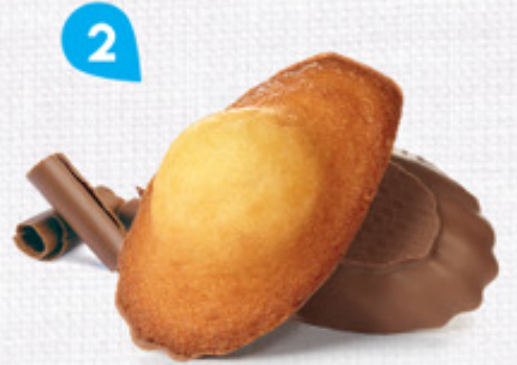
2 MADELEINES CHOCOLAT 50 emballages individuels - 1080 g DDM* : 2 mois