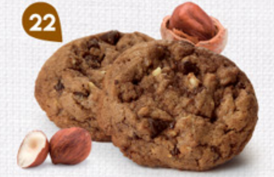
22 COOKIES CHOCOLAT NOISETTES 24 étuis de 2 - 450 g DDM* : 5 mois