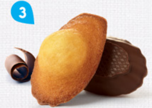
3 MADELEINES CHOCHOINOIR 50 emballages individuels - 1080 g DDM* : 2 mois