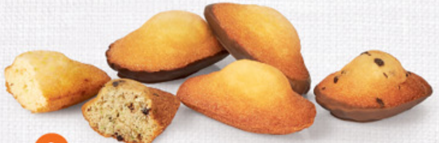
8 FARANDOLE DE MADELEINES 30 emballages individuels - 590 g - 5 Madeleines Nature - 5 Madeleines ChocoLait - 5 Madeleines ChocoNoir - 5 Madeleines ChocoPistache - 5 Madeleines Double Choc - 5 Madeleines Citron DDM* : 2 mois