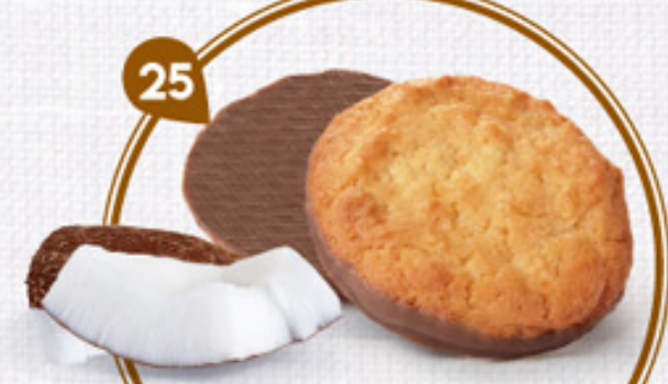
25 SABLÉS COCOLAIT 24 étuis de 2 - 480 g DDM* : 5 mois