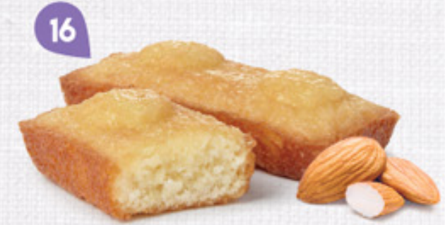
16 FINANCIERS AUX AMANDES 30 emballages individuels - 660 g DDM* : 2 mois