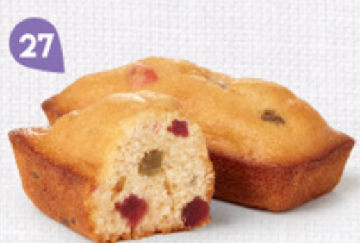
27 CAKES AUX FRUITS 20 emballages individuels - 600 g DDM* : 2 mois