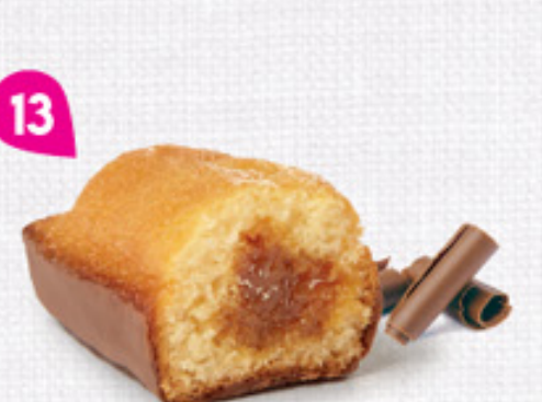
13 BIJOU CARAMEL CHOCOLAIT 20 emballages individuels - 740 g DDM* : 2 mois