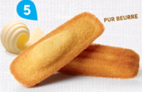
5 LONGUES NATURE 20 étuis de 2 - 490 g DDM* : 2 mois