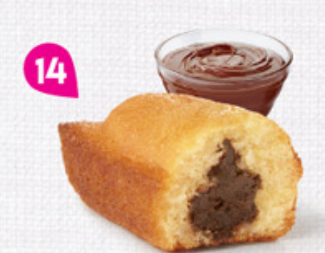
14 BIJOU CACAO 20 emballages individuels - 660 g DDM* : 2 mois