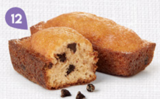
12 CHOCOPÉPITES 20 emballages individuels - 500 g DDM* : 2 mois